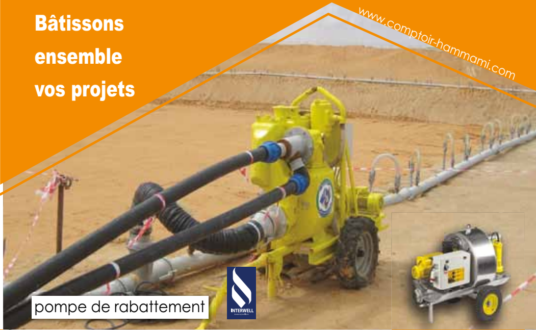
pompe de rabattement