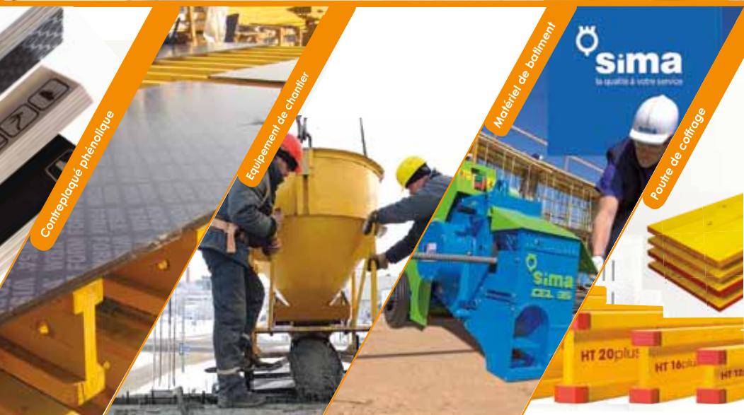
Contreplaqué - phénolique